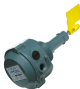
P10166 SENSORE DI LIVELLO ROTATIVO Sensore motorizzato in bassa tensione 24V con paletta rotante, certificato ATEX Z21