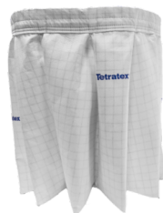
PTFE ANT Filtro PTFE antistatico (Classe M EN 60335-2-69)