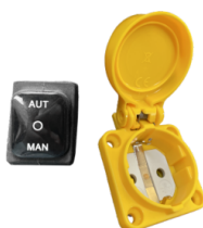
RC SCHUKO Controllo remoto da elettrotensile (MAX 2000 W)