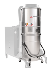
GX Camera e contenitore acciaio INOX AISI 304