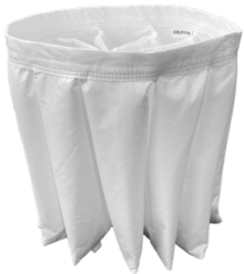
PTFE Filtro PTFE (Classe M EN 60335-2-69)