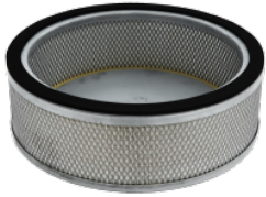
HEPA 14 Filtro assoluto (EN 1822) 22.000 cm 2 superficie filtrante Classe H14 (EN 1822) Fibra di vetro