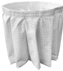
ANT M Filtro antistatico (Classe M EN 60335-2-69)