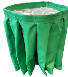
MTF Filtro teflonato (Classe M EN 60335-2-69)