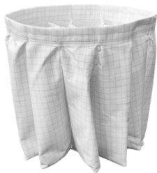
ANT M Filtro antistatico (Classe M EN 60335-2-69)