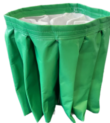
MTF Filtro teflonato (Classe M EN 60335-2-69)