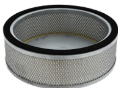
HEPA 14 Filtro assoluto (EN 1822) 22.000 cm 2 superficie filtrante Classe H14 (EN 1822) Fibra di vetro