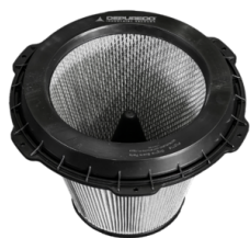
HEPA 13 Filtro assoluto (EN 1822) 35.000 cm 2 superficie filtrante Classe H13 (EN 1822) Fibra di vetro