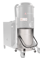
BX Contenitore in acciaio INOX AISI 304