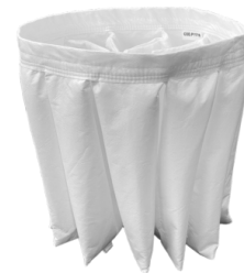
PTFE Filtro PTFE (Classe M EN 60335-2-69)