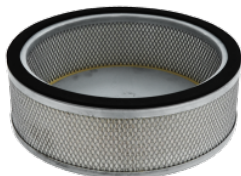
HEPA 14 Filtro assoluto (EN 1822) 22.000 cm 2 superficie filtrante Classe H14 (EN 1822) Fibra di vetro