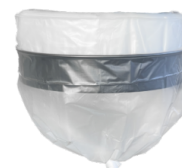
LP Sistema di raccolta a rotolo continuo Endless Bag Sistema insaccamento Longopac