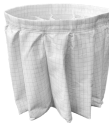
ANT M Filtro antistatico (Classe M EN 60335-2-69)