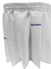
PTFE ANT Filtro PTFE antistatico (Classe M EN 60335-2-69)