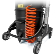
KDP KIT differenziale di pressione per insaccamento