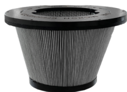
HEPA 13 Filtro assoluto (EN 1822) 35.000 cm 2 superficie filtrante Classe H13 (EN 1822) Fibra di vetro