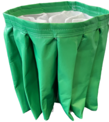
MTF Filtro teflonato (Classe M EN 60335-2-69)