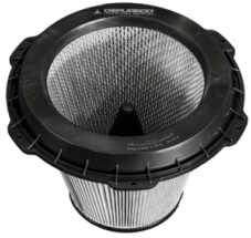
HEPA 13 Filtro assoluto (EN 1822) 35.000 cm 2 superficie filtrante Classe H13 (EN 1822) Fibra di vetro