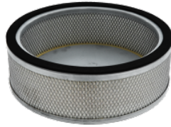
HEPA 14 Filtro assoluto (EN 1822) 22.000 cm 2 superficie filtrante Classe H14 (EN 1822) Fibra di vetro