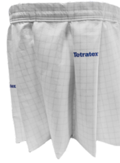
PTFE ANT Filtro PTFE antistatico (Classe M EN 60335-2-69)