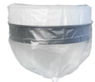
LP Sistema di raccolta a rotolo continuo Endless Bag Sistema insaccamento Longopac