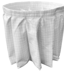
ANT M Filtro antistatico (Classe M EN 60335-2-69)