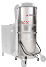
GX Camera e contenitore acciaio INOX AISI 304