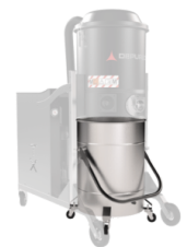
BX Contentore in acciaio INOX AISI 304