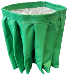
MTF Filtro teflonato (Classe M EN 60335-2-69)