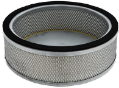
HEPA 14 Filtro assoluto (EN 1822) 28.000 cm 2 superficie filtrante Classe H14 (EN 1822) Fibra di vetro