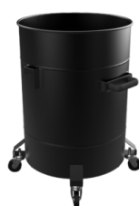
100 LT Contentore 100 lt.