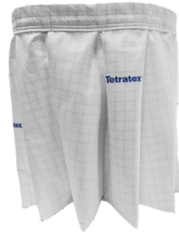
PTFE ANT Filtro PTFE antistatico (Classe M EN 60335-2-69)