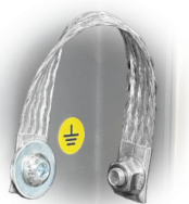
GRD Messa a terra