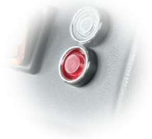
SPIA DI INTASAMENTO FILTRO Spia per segnalazione di filtro ostruito o da sostituire