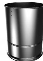
COSTRUZIONE IN ACCIAIO Robusta costruzione in acciaio verniciato industriale