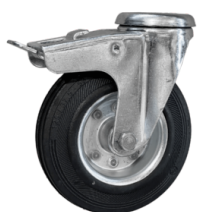
RUOTA CON FRENO Ruota antitraccia con freno integrato