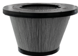
HEPA 13 Filtro assoluto (EN 1822) 35.000 cm 2 superficie filtrante Classe H13 (EN 1822) Fibra di vetro