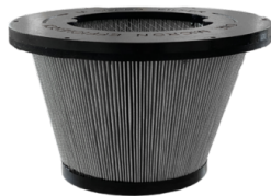
HEPA 13 Filtro assoluto (EN 1822) 35.000 cm 2 superficie filtrante Classe H13 (EN 1822) Fibra di vetro