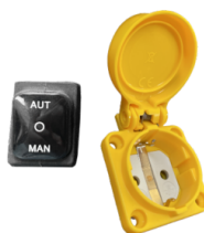
RC SCHUKO Controllo remoto da elettrotensile (MAX 2000 W)