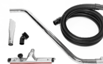
P12348 DRY KIT Ø 50MM Kit completo di accessori specifici per aspirazione polveri e solidi in diametro 50 mm