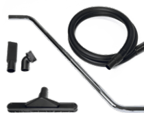
P13640 DRY KIT Ø 40MM Kit completo di accessori specifici per aspirazione polveri e solidi in diametro 40 mm