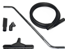
P13640 DRY KIT Ø 40MM Configurazione ottimizzata per la pulizia accurata di pavimenti e superfici da polveri asciutte. - 3mt Tubo Evaflex - 1x Manicotto in go ...