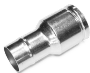
P10866 TERMINALE IN ACCIAIO Ø 70/50MM Riduzione per innesto rapido aspiratore in acciaio zincato diametro 70/50 mm