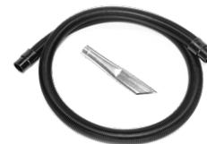
P12350 STARTER KIT Ø 50MM Soluzione essenziale e compatta per interventi di aspirazione rapida su superfici semplici. - 3mt Tubo Evaflex - 2x manicotto in gomma ant ...