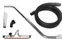
P12348 DRY KIT Ø 50MM Kit per il trattamento di ampie superfici da polveri asciutte che richiedono alta efficienza di aspirazione. - 3mt Tubo Evaflex - 2x Man ...