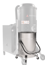
BX Contenitore in acciaio INOX AISI 304