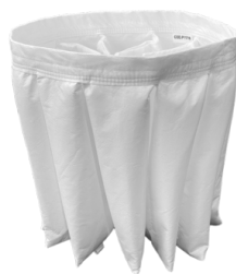
PTFE Filtro PTFE (Classe M EN 60335-2-69)