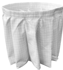
ANT M Filtro antistatico (Classe M EN 60335-2-69)