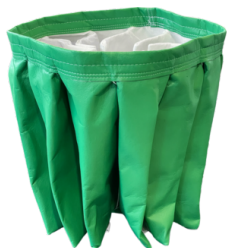
MTF Filtro teflonato (Classe M EN 60335-2-69)