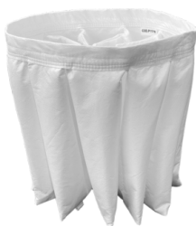
BFL Filtro classe M 38.000 cm 2