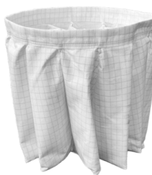
ANT M Filtro antistatico (Classe M EN 60335-2-69)