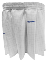
PTFE ANT Filtro PTFE antistatico (Classe M EN 60335-2-69)