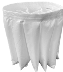
PTFE Filtro PTFE (Classe M EN 60335-2-69)