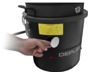
JC Jet Clean Pulizia semiautomatica a contro corrente d'aria, classe M filtro (EN 60335-2-69), 1 filtro cartuccia poliestere, 4 m 2 superficie filtrante, ghigliottina non inclusa