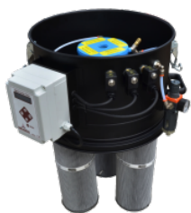
SP Pulizia cartucce in controcorrente d'aria Filtro antistatico classe M (EN 60335-2-69) 3 Cartucce poliestere antistatico 9 m 2 superficie filtrante