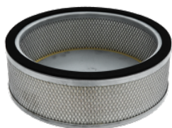
HEPA 14 Filtro assoluto (EN 1822) 22.000 cm 2 superficie filtrante Classe H14 (EN 1822) Fibra di vetro