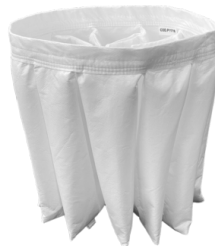
PTFE Filtro PTFE (Classe M EN 60335-2-69)