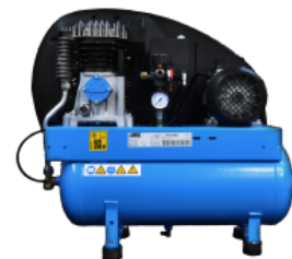
COM Compressore a bordo Compressore montato su carenatura posteriore