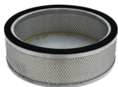
HEPA 14 Filtro assoluto (EN 1822) 28.000 cm 2 superficie filtrante Classe H14 (EN 1822) Fibra di vetro