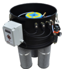
SP Pulizia cartucce in controcorrente d'aria Filtro antistatico classe M (EN 60335-2-69) 3 Cartucce poliestere antistatico 9 m 2 superficie filtrante