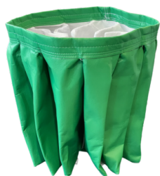
MTF Filtro teflonato (Classe M EN 60335-2-69)