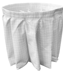
ANT M Filtro antistatico (Classe M EN 60335-2-69)