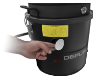
JC Jet Clean Pulizia semiautomatica a contro corrente d'aria, classe M filtro (EN 60335-2-69), 1 filtro cartuccia poliestere, 4 m 2 superficie filtrante, ghigliottina non inclusa