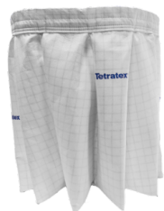
PTFE ANT Filtro PTFE antistatico (Classe M EN 60335-2-69)