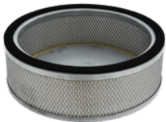
HEPA 14 Filtro assoluto (EN 1822) 28.000 cm 2 superficie filtrante Classe H14 (EN 1822) Fibra di vetro