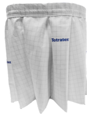
PTFE ANT Filtro PTFE antistatico (Classe M EN 60335-2-69)