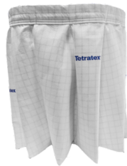
PTFE ANT Filtro PTFE antistatico (Classe M EN 60335-2-69)