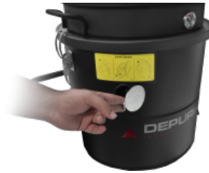
JC Jet Clean Pulizia semiautomatica a contro corrente d'aria, classe M filtro (EN 60335-2-69), 1 filtro cartuccia poliestere, 4 m 2 superficie filtrante, ghigliottina non inclusa