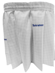
PTFE ANT Filtro PTFE antistatico (Classe M EN 60335-2-69)