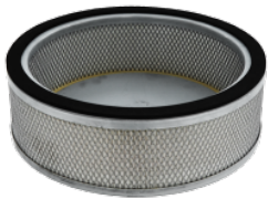
HEPA 14 Filtro assoluto (EN 1822) 28.000 cm 2 superficie filtrante Classe H14 (EN 1822) Fibra di vetro