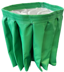
MTF Filtro teflonato (Classe M EN 60335-2-69)