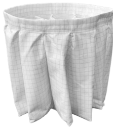
ANT M Filtro antistatico (Classe M EN 60335-2-69)