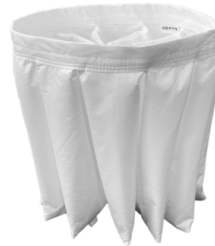
PTFE Filtro PTFE (Classe M EN 60335-2-69)