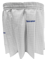
PTFE ANT Filtro PTFE antistatico (Classe M EN 60335-2-69)