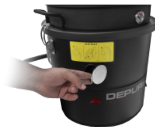
JC Jet Clean Pulizia semiautomatica a contro corrente d'aria, classe M filtro (EN 60335-2-69), 1 filtro cartuccia poliestere, 4 m 2 superficie filtrante, ghiottina non inclusa