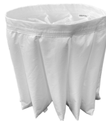
PTFE Filtro PTFE (Classe M EN 60335-2-69)