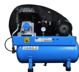
COM Compressore a bordo Compressore montato su carenatura posteriore