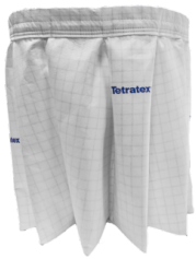
PTFE ANT Filtro PTFE antistatico (Classe M EN 60335-2-69)