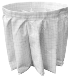
ANT M Filtro antistatico (Classe M EN 60335-2-69)