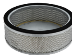
HEPA 14 Filtro assoluto (EN 1822) 22.000 cm 2 superficie filtrante Classe H14 (EN 1822) Fibra di vetro