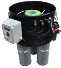
SP Pulizia cartucce in controcorrente d'aria Filtro antistatico classe M (EN 60335-2-69) 3 Cartucce poliestere antistatico 9 m 2 superficie filtrante