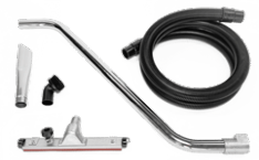
P11887 KIT WET & DRY Ø 50MM Kit completo di accessori specifici per aspirazione solidi e liquidi in diametro 50 mm