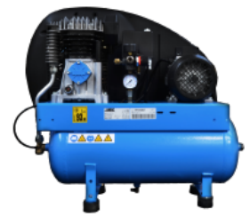
COM Compressore a bordo Compressore montato su carenatura posteriore