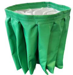
MTF Filtro teflonato (Classe M EN 60335-2-69)