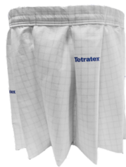
PTFE ANT Filtro PTFE antistatico (Classe M EN 60335-2-69)