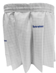
PTFE ANT Filtro PTFE antistatico (Classe M EN 60335-2-69)