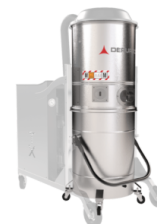
GX Camera e contenitore acciaio INOX AISI 304