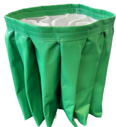
MTF Filtro teflonato (Classe M EN 60335-2-69)