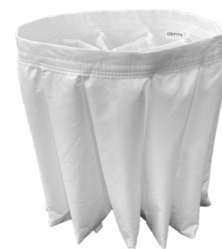
PTFE Filtro PTFE (Classe M EN 60335-2-69)