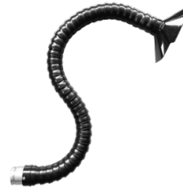
P13970 BRACCIO ASPIRANTE SNODATO D70 Braccio di aspirazione flessibile in PVC installabile su modelli già esistenti - 1,2 mt lunghezza - d70