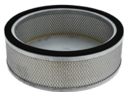
HEPA 14 Filtro assoluto (EN 1822) 22.000 cm 2 superficie filtrante Classe H14 (EN 1822) Fibra di vetro