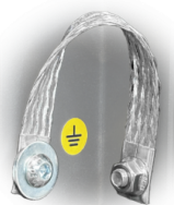
GRD Messa a terra