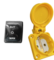
RC SCHUKO Controllo remoto da elettrotensile (MAX 2000 W)