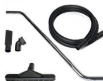
P13640 DRY KIT Ø 40MM

Kit completo di accessori specifici per aspirazione polveri e solidi in diametro 50 mm