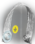
GRD Messa a terra