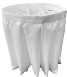
PTFE Filtro PTFE (Classe M EN 60335-2-69)