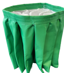
MTF Filtro teflonato (Classe M EN 60335-2-69)