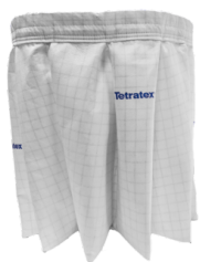
PTFE ANT Filtro PTFE antistatico (Classe M EN 60335-2-69)