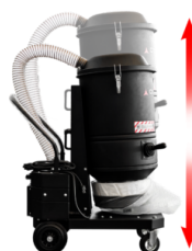
TELAIO TELESCOPICO Per ridurre l'ingombro e facilitare il trasporto