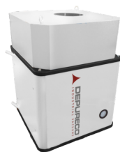
PRE H Pre-Cartuccia