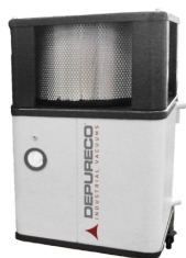
POST H Post-Cartuccia