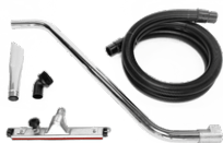
P12348 DRY KIT Ø 50MM

Kit completo di accessori specifici per aspirazione solidi e liquidi in diametro 50 mm