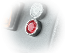
SPIA DI INTASAMENTO FILTRO

Spia per segnalazione di filtro ostruito o da sostituire