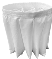
PTFE Filtro PTFE (Classe M EN 60335-2-69)