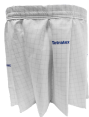
PTFE ANT Filtro PTFE antistatico (Classe M EN 60335-2-69)