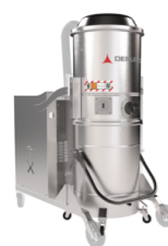
TX Contenitore camera e struttura in acciaio INOX AISI 304