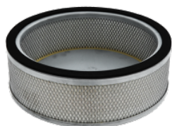
HEPA 14 Filtro assoluto (EN 1822) 22.000 cm 2 superficie filtrante Classe H14 (EN 1822) Fibra di vetro