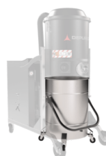
BX Contenitore in acciaio INOX AISI 304