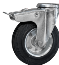
RUOTA CON FRENO Ruota antitraccia con freno integrato