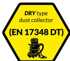
ASPIRATORE DRY TYPE Aspiratore certificato ATEX con filtrazione delle polveri a secco, come da EN17348