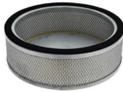
HEPA 14 Absolutfilter (EN 1822) 22.000 cm 2 Filterfläche Antistatischer H14 Klasse Filter (EN 1822) Glasfaser