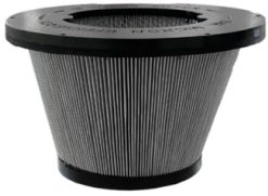
HEPA 13 Absolutfilter (EN 1822) 35.000 cm 2 Filterfläche Antistatischer H13 Klasse Filter (EN 1822) Glasfaser