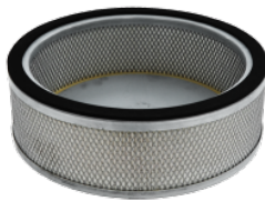
HEPA 14 Absolutfilter (EN 1822) 22.000 cm 2 Filterfläche Antistatischer H14 Klasse Filter (EN 1822) Glasfaser