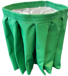
MTF Teflon Filter (M Klasse EN 60335-2-69)