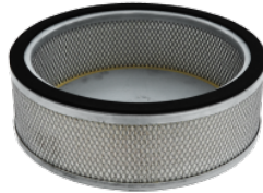
HEPA 14 Absolutfilter (EN 1822) 22.000 cm² Filterfläche Antistatischer H14 Klasse Filter (EN 1822) Glasfaser