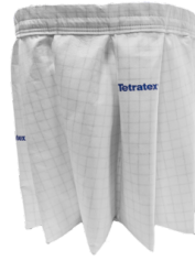
PTFE ANT Antistatischer PTFE Filter (M Klasse EN 60335-2-69)