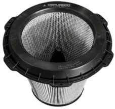
HEPA 13 Absolutfilter (EN 1822) 35.000 cm² Filterfläche Antistatischer H13 Klasse Filter (EN 1822) Glasfaser