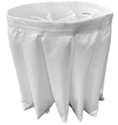
PTFE PTFE Filter (M Klasse EN 60335-2-69)