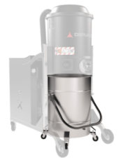
BX Cuve en acier INOX AISI 304