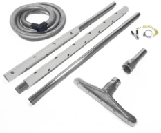
P11857 OFENREINIGUNG KIT Ø 40MM

Zubehör-Kit zum Aussaugen von Öfen mit 3 m langer Verbrennungsschutz-Verlängerung und Metallschlauch.