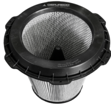
HEPA 13 Filtre absolu (EN 1822) 35.000 cm 2 surface filtrante Filtre antistatique classe H13 (EN 1822) Fibres de verre