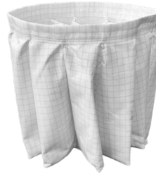
ANT M Filtro antiestático (M clase EN 60335-2-69)