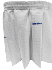
PTFE ANT Filtro antiestático PTFE (M clase EN 60335-2-69)