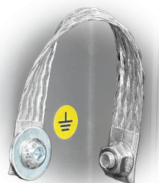
GRD Puesta a tierra