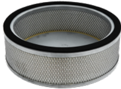
HEPA 14 Filtro absoluto (EN 1822) 22.000 cm 2 superficie filtrante Filtro antiestático clase H14 (EN 1822) Fibra de vidrio