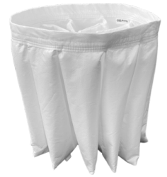
PTFE Filtro PTFE (M clase EN 60335-2-69)