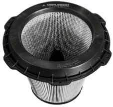
HEPA 13 Filtro absoluto (EN 1822) 35.000 cm 2 superficie filtrante Filtro antiestático clase H13 (EN 1822) Fibra de vidrio