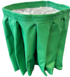
MTF Filtro Teflon (M clase EN 60335-2-69)