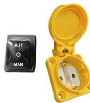
RC SCHUKO Control remoto desde herramientas eléctricas (MAX 2000 W)