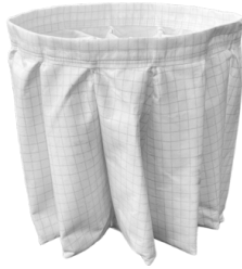
ANT M Filtro antiestático (M clase EN 60335-2-69)