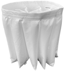
PTFE Filtro PTFE (M clase EN 60335-2-69)