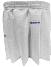
PTFE ANT Filtro antiestático PTFE (M clase EN 60335-2-69)