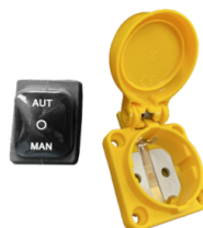
RC SCHUKO Control remoto desde herramientas eléctricas (MAX 2000 W)