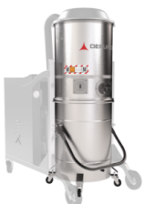
GX Cámara y contenedor en acero INOX AISI 304á