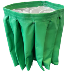
MTF Filtro Teflon (M clase EN 60335-2-69)