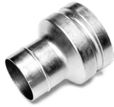
P00278 RÉDUCTION EN ACIER Ø 80/50MM Réduction pour flexible en acier galvanisé diam 80/50