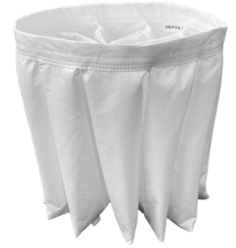
BFL Filtre classe M 38.000 cm 2