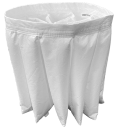
PTFE Filtre PTFE (Classe M EN 60335-2-69)