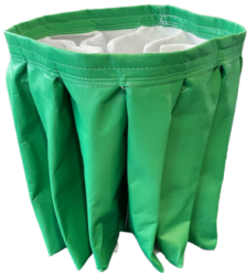
MTF Filtre teflon (Classe M EN 60335-2-69)