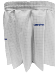
PTFE ANT Filtre PTFE antistatique (Classe M EN 60335-2-69)