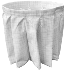
ANT M Filtre antistatique (Classe M EN 60335-2-69)