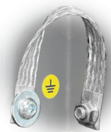
GRD Mise à la terre