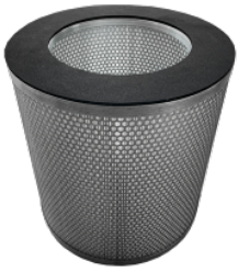
HEPA 14 Filtre absolu (EN 1822) 110.000 cm 2 surface filtrante Filtre antistatique classe H14 (EN 1822) Fibres de verre