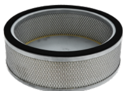
HEPA 14 Filtre absolu (EN 1822) 28.000 cm 2 surface filtrante Filtre antistatique classe H14 (EN 1822) Fibres de verre