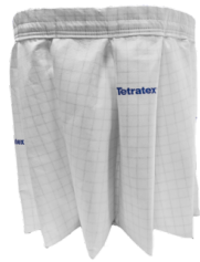
PTFE ANT Antistatischer PTFE Filter (M Klasse EN 60335-2-69)