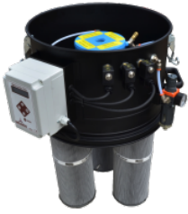
SP Druckluftabreinigung Antistatischer M Klasse Filter (EN 60335-2-69), 3 Polyester Filterpatrone, 9 m 2 Filterfläche