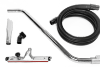
P12348 KIT ZUM TROCKENEINSATZ Ø 50MM Komplett-Kit mit Zubehör zum Aufsaugen von Staub und Feststoffen, Durchmesser: 50 mm