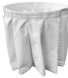
ANT M Antistatischer Filter (M Klasse EN 60335-2-69)