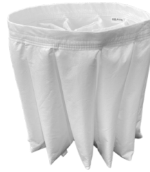
PTFE PTFE Filter (M Klasse EN 60335-2-69)