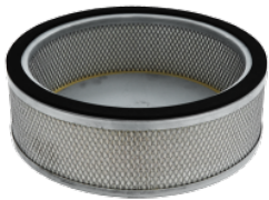
HEPA 14 Absolutfilter (EN 1822) 22.000 cm 2 Filterfläche Antistatischer H14 Klasse Filter (EN 1822) Glasfaser