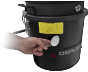
JC Jet Clean Abreinigungssystem