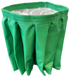
MTF Teflon Filter (M Klasse EN 60335-2-69)