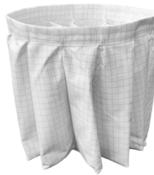
ANT M Antistatischer Filter (M Klasse EN 60335-2-69)