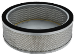
HEPA 14 Absolutfilter (EN 1822) 22.000 cm 2 Filterfläche Antistatischer H14 Klasse Filter (EN 1822) Glasfaser