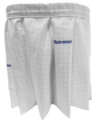
PTFE ANT Antistatischer PTFE Filter (M Klasse EN 60335-2-69)