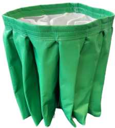
MTF Teflon Filter (M Klasse EN 60335-2-69)