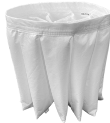
PTFE PTFE Filter (M Klasse EN 60335-2-69)