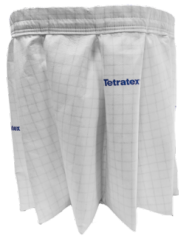
PTFE ANT Filtru antistatic PTFE (clasa M EN 60335-2-69)