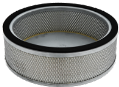
HEPA 14 Filtru absolut (EN 1822) 22.000 cm 2 filter surface H14 Class Filter (EN 1822) Glass fiber