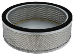
HEPA 14 Filtru absolut (EN 1822) 22.000 cm 2 filter surface H14 Class Filter (EN 1822) Glass fiber