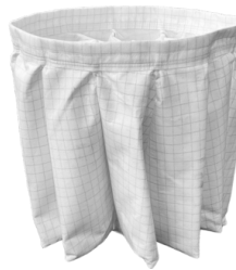
ANT M Filtru antistatic (clasa M EN 60335-2-69)