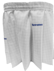
PTFE ANT Filtre PTFE antistatique (Classe M EN 60335-2-69)