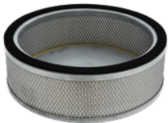
HEPA 14 Filtre absolu (EN 1822) 28.000 cm 2 surface filtrante Filtre antistatique classe H14 (EN 1822) Fibres de verre