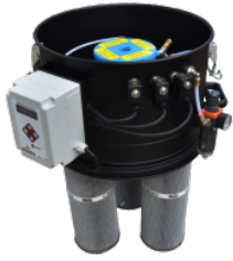
SP Décolmatage cartouches par injection air réseau air comprimé Filtre antistatique classe M (EN 60335-2-69), 3 cartouches polyester antistatique, 9 m 2 surface filtrante