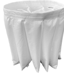
PTFE Filtre PTFE (Classe M EN 60335-2-69)