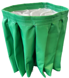
MTF Filtre teflon (Classe M EN 60335-2-69)