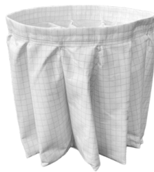
ANT M Filtre antistatique (Classe M EN 60335-2-69)