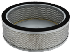
HEPA 14 Absolutfilter (EN 1822) 28.000 cm 2 Filterfläche Antistatischer H14 Klasse Filter (EN 1822) Glasfaser