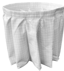
ANT M Antistatischer Filter (M Klasse EN 60335-2-69)