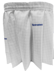
PTFE ANT Antistatischer PTFE Filter (M Klasse EN 60335-2-69)