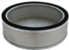
HEPA 14 Absolutfilter (EN 1822) 28.000 cm 2 Filterfläche Antistatischer H14 Klasse Filter (EN 1822) Glasfaser