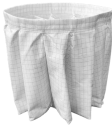
ANT M Antistatischer Filter (M Klasse EN 60335-2-69)