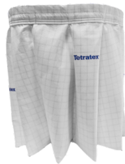
PTFE ANT Filtru antistatic PTFE (clasa M EN 60335-2-69)