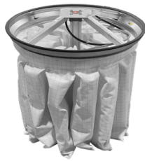
PSC Agitator cu filtru pneumatic semi-automat