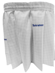
PTFE ANT Filtru antistatic PTFE (clasa M EN 60335-2-69)