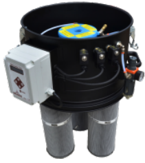
SP Sistem de curățare a filtrului cu jet invers