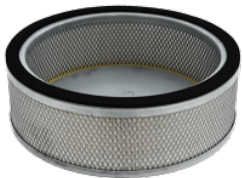
HEPA 14 Filtru absolut (EN 1822) 28.000 cm 2 filter surface H14 Class Filter (EN 1822) Glass fiber