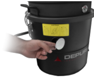
JC Jet Clean