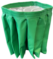
MTF Filtru de teflon (clasa M EN 60335-2-69)