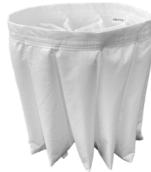
PTFE Filtru PTFE (clasa M EN 60335-2-69)