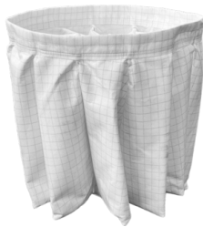
ANT M Filtru antistatic (clasa M EN 60335-2-69)