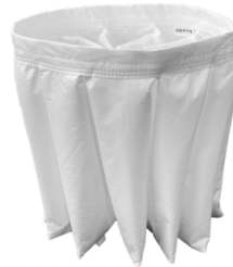
PTFE Filtru PTFE (clasa M EN 60335-2-69)