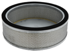
HEPA 14 Filtru absolut (EN 1822) 28.000 cm 2 filter surface H14 Class Filter (EN 1822) Glass fiber