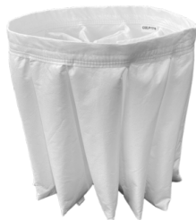
PTFE PTFE Filter (M Klasse EN 60335-2-69)