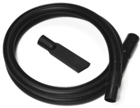
P13638 STARTER KIT Ø 40MM Basis-Kit mit Zubehör zum Aufsaugen von Feststoffen und Flüssigkeiten, Durchmesser: 50 mm