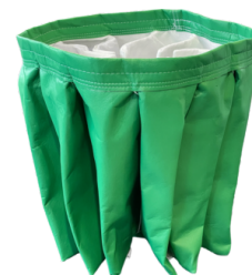
MTF Teflon Filter (M Klasse EN 60335-2-69)