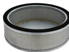
HEPA 14 Absolutfilter (EN 1822) 22.000 cm 2 Filterfläche Antistatischer H14 Klasse Filter (EN 1822) Glasfaser