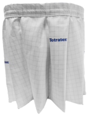
PTFE ANT Antistatischer PTFE Filter (M Klasse EN 60335-2-69)