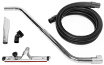
P12348 KIT ZUM TROCKENEINSATZ Ø 50MM Komplett-Kit mit Zubehör zum Aufsaugen von Staub und Feststoffen, Durchmesser: 50 mm