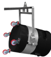
P01033 KIPPVORRICHTUNG – ABSTANDSCHELLE Ø 450MM Bügel zum Heben des Behälters mit einem Gabelstapler, Durchmesser des Behälters mit Hebering: 450 mm. Auf diese Weise kann der Behälter ...