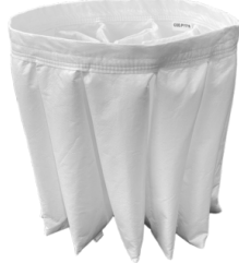
PTFE PTFE Filter (M Klasse EN 60335-2-69)