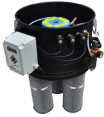
SP Druckluftabreinigung Antistatischer M Klasse Filter (EN 60335-2-69), 3 Polyester Filterpatrone, 9 m 2 Filterfläche