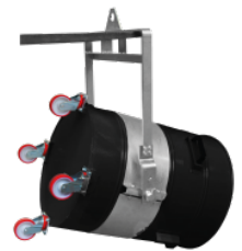
P11287 KIPPVORRICHTUNG – RING Ø 450MM Ring zum Heben des Behälters, Durchmesser: 450 mm. Unerlässlich bei einer Verwendung mit dem Hebebügel. Mithilfe dieser beiden Vorrichtun...