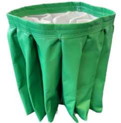
MTF Teflon Filter (M Klasse EN 60335-2-69)