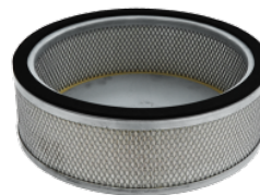
HEPA 14 Absolutfilter (EN 1822) 22.000 cm 2 Filterfläche Antistatischer H14 Klasse Filter (EN 1822) Glasfaser