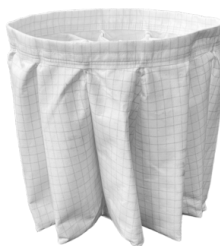
ANT M Antistatischer Filter (M Klasse EN 60335-2-69)