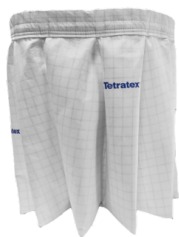
PTFE ANT Antistatischer PTFE Filter (M Klasse EN 60335-2-69)