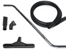
P13640 KIT ZUM TROCKENEINSATZ Ø 40MM Komplett-Kit mit Zubehör zum Aufsaugen von Staub und Feststoffen, Durchmesser: 40 mm