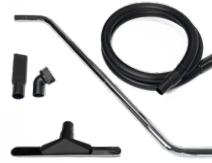
P13639 WET & DRY KIT Ø 40MM Komplett-Kit mit Zubehör zum Aufsaugen von Feststoffen und Flüssigkeiten, Durchmesser: 40 mm