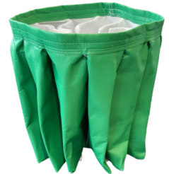
MTF Teflon Filter (M Klasse EN 60335-2-69)