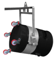
P11287 KIPPVORRICHTUNG – RING Ø 450MM Ring zum Heben des Behälters, Durchmesser: 450 mm. Unerlässlich bei einer Verwendung mit dem Hebebügel. Mithilfe dieser beiden Vorrichtun...