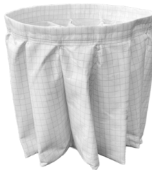
ANT M Antistatischer Filter (M Klasse EN 60335-2-69)